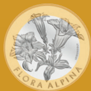
Fleur de coin

Valeur nominale légale: 18,85 francs suisses Alliage: cupronickel et bronze d'aluminium Dimensions: 171 mm x 106 mm x 8 mm