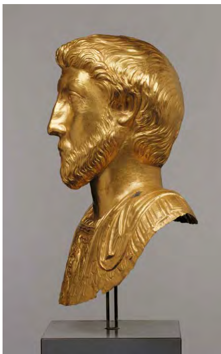
Image de profil du buste en or de l'empereur Marc Aurèle