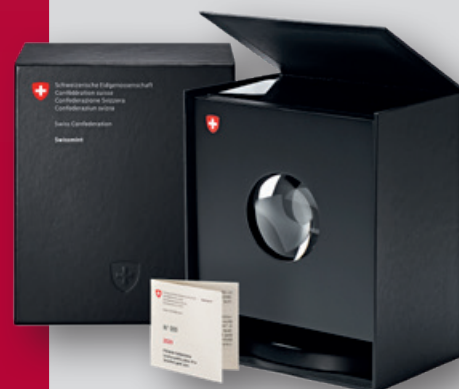
Pièce spéciale avec certificat d'authenticité

Jour d'émission: 23 janvier 2020 Délai de vente: 22 janvier 2023 ou dans la limite des stocks disponibles