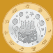
Fleur de coin

Valeur nominale légale: 8,85 francs suisses Alliage: cupronickel et bronze d'aluminium Dimensions: 171 mm x 106 mm x 8 mm