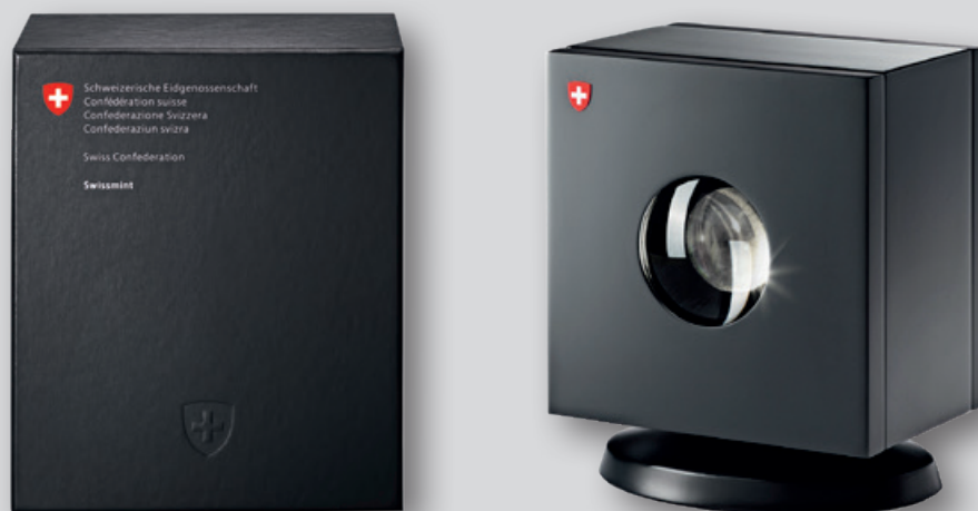
Boîte de conservation