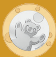
Fleur de coin

Valeur nominale légale: 8,85 francs suisses Alliage: cupronickel et bronze d'aluminium Dimensions: 171 mm x 106 mm x 8 mm