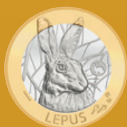
Fleur de coin

Valeur nominale légale: 18,85 francs suisses Alliage: cupronickel et bronze d'aluminium Dimensions: 171 mm x 106 mm x 8 mm