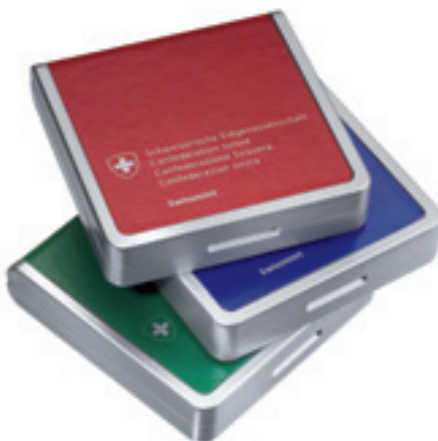
Les nouvelles étuis à monnaie.

Les étuis à monnaie ont été modifiés, ils ne l'avaient plus été depuis 1992. Par ailleurs, l'emballage des jeux de monnaies a subi quelques adaptations, étant donné que les pièces de un centime disparaîtront à l'avenir. Quelques nouveautés ont été apportées au jeu de monnaies pour