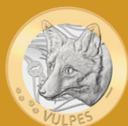
Fleur de coin