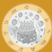
Fleur de coin

Valeur nominale légale: 8,85 francs suisses Alliage: cupronickel et bronze d'aluminium Dimensions: 171 mm x 106 mm x 8 mm Tirage: 2 000 pièces Jour d'émission: 1 er janvier 2021 Délai de vente: 31 décembre 2023 ou dans la limite des stocks disponibles