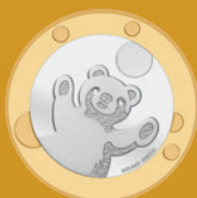
Fleur de coin

Valeur nominale légale: 8,85 francs suisses Alliage: cupronickel et bronze d'aluminium Dimensions: 171 mm x 106 mm x 8 mm Tirage: 7 000 pièces Jour d'émission: 1 er janvier 2021 Délai de vente: 31 décembre 2023 ou dans la limite des stocks disponibles