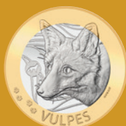
Fleur de coin

Valeur nominale légale: 18.85 francs suisses Alliage: cupronickel et bronze d'aluminium Dimensions: 171 mm x 106 mm x 8 mm Tirage: 8 000 pièces Jour d'émission: 21 janvier 2021 Délai de vente: 20 janvier 2024 ou dans la limite des stocks disponibles