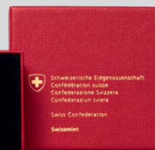
Flan bruni avec certificat d'authenticité