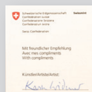
Variante «signée» en plus avec certificat de l'artiste