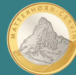
Cervin MONTAGNES SUISSES