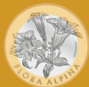
Fleur de coin

Valeur nominale légale: 18,85 francs suisses Alliage: cupronickel et bronze d'aluminium Poids: 176 g Dimensions: 171 mm x 106 mm x 8 mm