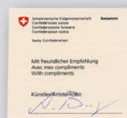
Variante «signée» en plus avec certificat de l'artiste