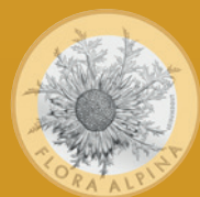
Fleur de coin