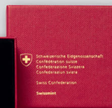
Flan bruni avec certificat d'authenticité