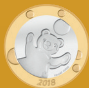
Fleur de coin

Valeur nominale légale: 8,85 francs suisses Alliage: cupronickel et bronze d'aluminium Dimensions: 171 mm x 106 mm x 8 mm Tirage: 10 000 pièces Jour d'émission: 1 er janvier 2018 Délai de vente: 31 décembre 2020 ou dans la limite des stocks disponibles