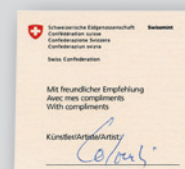
Variante «signée» en plus avec certificat de l'artiste