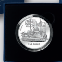
Flan bruni avec certificat d'authenticité