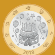
Fleur de coin

Valeur nominale légale: 8,85 francs suisses Alliage: cupronickel et bronze d'aluminium Dimensions: 171 mm x 106 mm x 8 mm Tirage: 3 000 pièces Jour d'émission: 1 er janvier 2018 Délai de vente: 31 décembre 2020 ou dans la limite des stocks disponibles