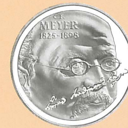
Conrad Ferdinand Meyer