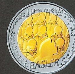
Carnaval de Bâle

Monnaie commémorative officielle de la Suisse