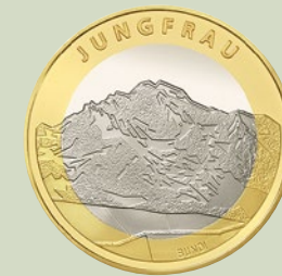
Jungfrau MONTAGNE SVIZZERE