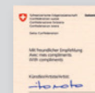
Variante «firmata» in più con certificato dell'artista