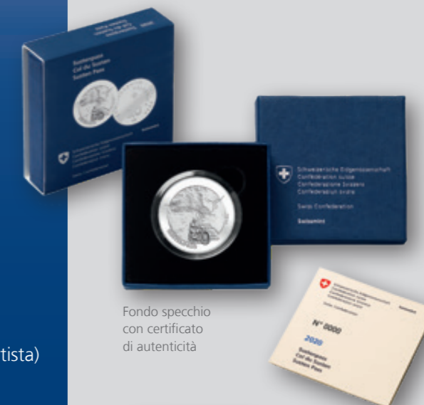
Fondo specchio con certificato di autenticità

* L'acquisto è limitato a un pezzo per nucleo familiare.