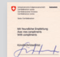
Variante «firmata» in più con certificato dell'artista