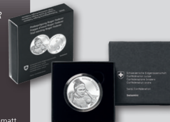
Prova di conio