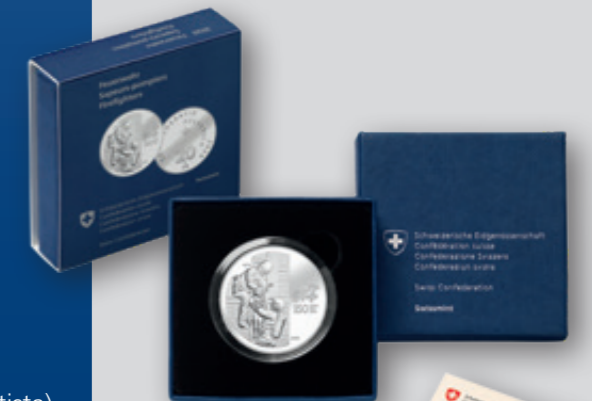
Fondo specchio con certificato di autenticità

* L'acquisto è limitato a un pezzo per nucleo familiare.