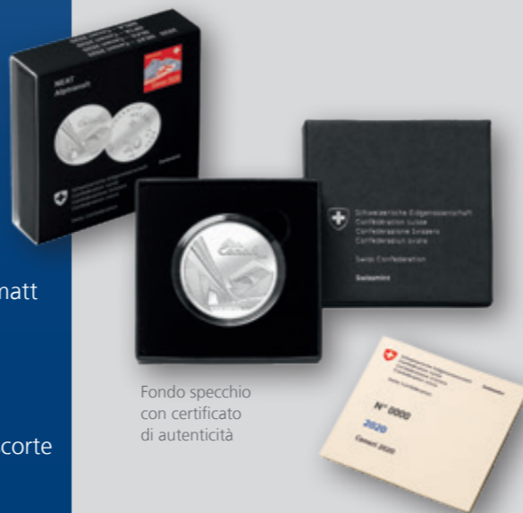
Fondo specchio con certificato di autenticità

La presente edizione non è inclusa nell'abbonamento e deve essere ordinata separatamente.