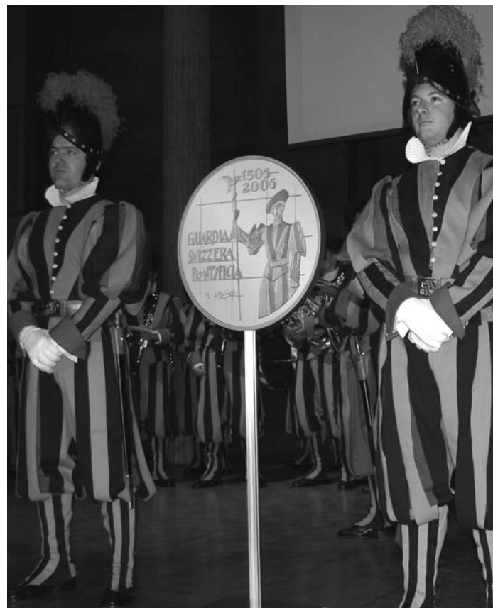
Présentation de la monnaie commémorative «500 ans de la Garde Suisse» lors de la cérémonie organisée à l'Université de Fribourg le 22 janvier 2006